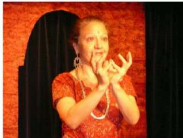
On retrouve dans le spectacle Deva-Kitatom un savant mélange de la danse kathakali, du texte conté et du chant carnatique.

Dans le kathakali la légende et la mythologie se mettent à vivre.